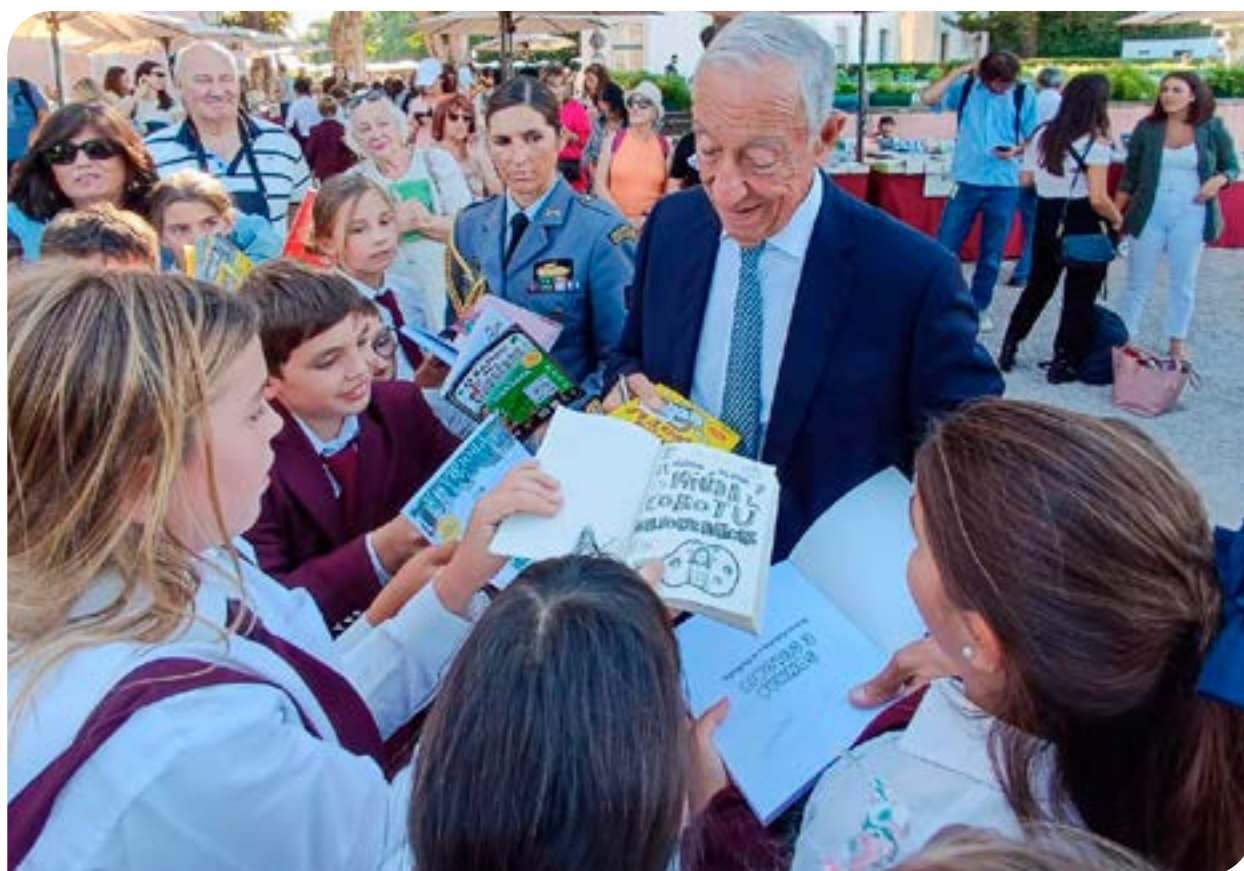
Festa do Livro de 2025 nos Jardins do Palácio de Belém

Queen Elizabeth's School (novembro de 1935 a 2025) - Fundação Denise Lester (fevereiro de 1965 a 2025)