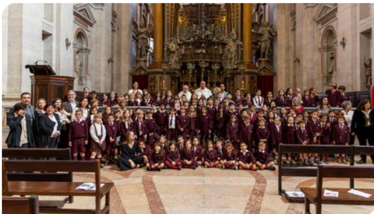
Missa de ação de graças pelo 90.º aniversário da Queen Elizabeth's School, presidida por Sua Eminência Reverendíssima D. Rui Valério, Patriarca de Lisboa